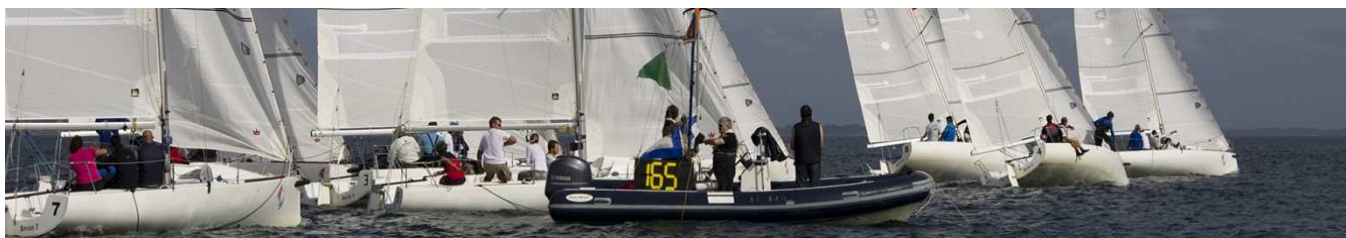
Service Formation de l'ENVSN

Possibilité d'hébergement et de restauration à l'ENVSN (voir fiche de réservation)